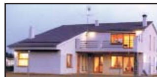
Proyectos construidos Arquitectura efímera Concursos