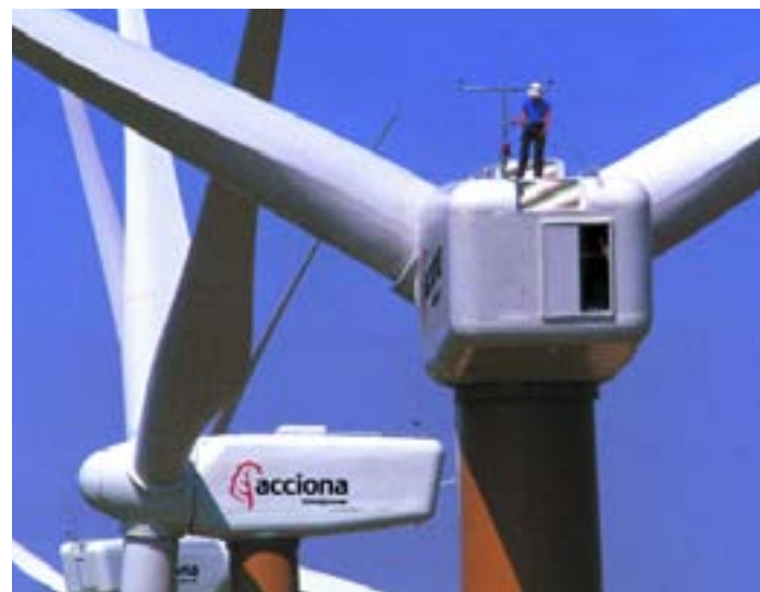
ACCIONA es uno de los líderes mundiales en la implantación de parques eólicos

La citada integración de activos, unida a las instalaciones que ACCIONA va a culminar en el presente ejercicio, situará a la compañía con 8.800 MW instalados en energías renovables al cierre del ejercicio, de los que más de 7.300 lo serán en propiedad. ■