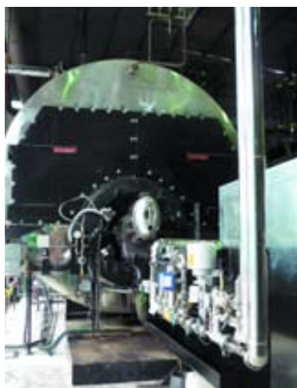
Grupo SOS-Andujar (Jaén)-Tres calderas de vapor saturado 15 tn/h c.u. a 16 bar-Combustible: Glicerina cruda (80%) + Gas Natural (20%)

sadeca@vulcanosadeca.es www.vulcanosadeca.es