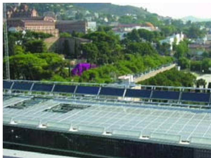
Escuela de Arquitectura e Ingeniería La Salle (Barcelona)

Los paneles radiantes revisitan parte de la superficie de techos o paredes y funcionan como una piel atemperada, que trabajando a temperaturas ligeramente superiores o inferiores a la ambiente (según se trate de calefactar o refrigerar, respetivamente)