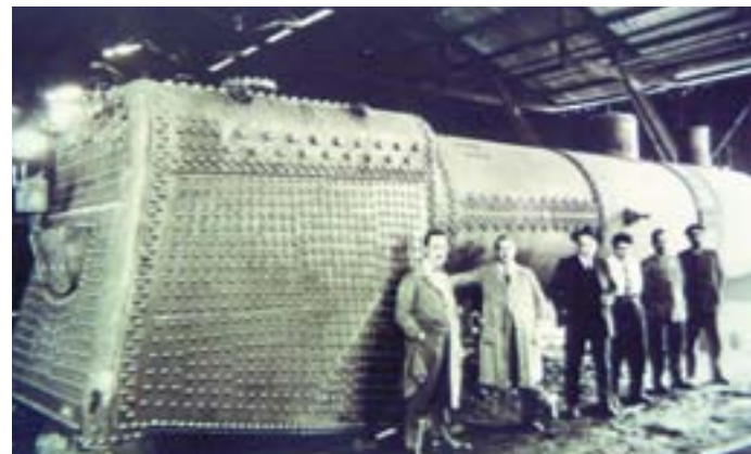
Máquina de vapor construida- Principios Siglo XX

▶ Son calderas destinadas a la calefacción de edificios residenciales, hoteles, centros de educación,