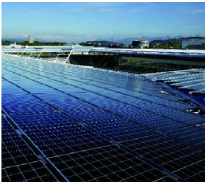
Instalación fotovoltaica de 1,35 MW con paneles Kyocera, en Berna sobre el Stade de Suisse

Como fabricante la empresa TRITEC es especialista en técnica de medición, destacando entre nuestros productos los sensores de radiación y temperatura y nuestro analizador portátil de curvas características para instalaciones fotovoltaicas TRI-KA.