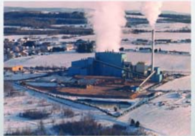
Central de Biomasa Fort Fairfield 35 MW, FAIRFIELD ENERGY VENTURE, Maine (Estados Unidos)