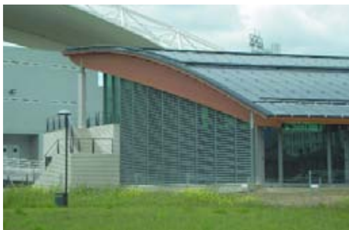
Cubierta solar en la Piscina Municipal de Haro (La Rioja)

Gracias a las actuales instalaciones productivas y departamentos de ingeniería ubicados estratégicamente en Suiza (Sierre) y España (Barcelona), y a los acuerdos establecidos en países como Francia, Alemania, Italia e Inglaterra, Energie Solaire ofrece a sus clientes soluciones integrales adaptadas a sus necesidades particulares. Dicho servicio engloba desde la concepción preliminar de las soluciones