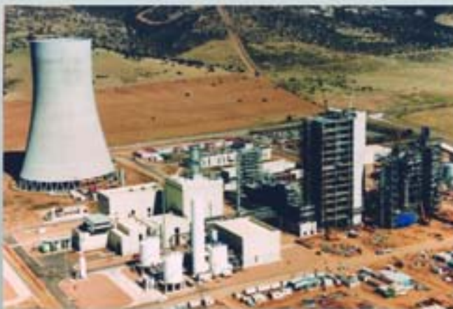
Central Gasificación Ciclo Combinado IGCC 335 MW ELCOGAS Puertollano (España)