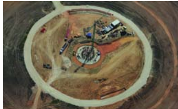
Avance de las obras de Gemasolar

La UTE formada por SENER y AMSA, empresa filial de ACS Cobra, se ha adjudicado el contrato EPC (Engineering, Procurement and Construction) en la modalidad