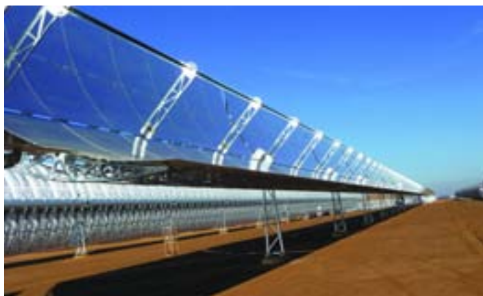
Sistema de SENERthrough que se va a instalar en Valle 1 y Valle 2.

Torresol Energy es una empresa participada por SENER, el Grupo de ingeniería español, y MASDAR, empresa del fondo soberano de Abu Dhabi para inversión en energías renovables. Desde su creación, en marzo de 2008, Torresol Energy tiene el objetivo de convertirse en líder mundial en el sector de la energía termosolar por concentración y la misión de promover el desarrollo y la explotación de grandes plantas de energía termosolar por todo el mundo, especialmente en el llamado 'cinturón solar': el sur de Europa, el norte de África, la región de Oriente Medio y el suroeste de EE UU. Según estas perspectivas, la base instalada en producción será de unos 320 MW a finales de 2013 y deberá alcanzar los 1.000 MW en 10 años.