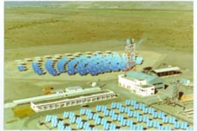
CESA 1. CIEMAT, Plataforma Solar de Almería (España)