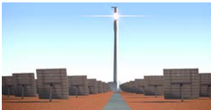
Vista artística de Gemasolar

La empresa de energía solar por concentración, alianza estratégica de SENER Grupo de Ingeniería y Masdar, cuenta con tres innovadores proyectos en construcción y dos más en cartera. Torresol Energy promociona y opera plantas que emplean tecnología punta, desarrollada por SENER, para hacer de la energía termosolar por concentración una alternativa viable a las energías de origen fósil, sobre la base de plantas rentables y eficientes que sean económicamente competitivas.