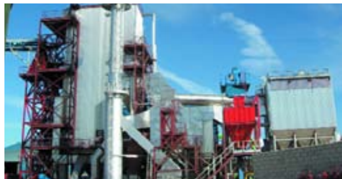
Planta de Cogeneración en Cabra (Córdoba)-Producción de vapor sobrecalentado 405°C de 35 Tn/h a 42 bar-Acuotubular-Combustible: Orujillo-Emissiones referidas al 11% de O2: CO(100mg/m3N - NOx (200mg/m3N - Partículas: 50 mg/m3N - Producción eléctrica: 8 Mwe

Por otro lado, están los servicios post-venta, donde además de