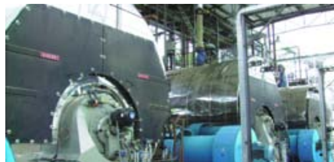
DESTILMEX-Sinaloa (MEXICO)-Tres calderas de vapor saturado 25 tn/h c.u. a 16 bar-Combustible: Combustóleo N° 6

Con esta novedad, Vulcano Sadeca ha conseguido un producto eficiente que ayuda a la sostenibilidad del medio ambiente. ¿Qué salida ha tenido en el mercado?