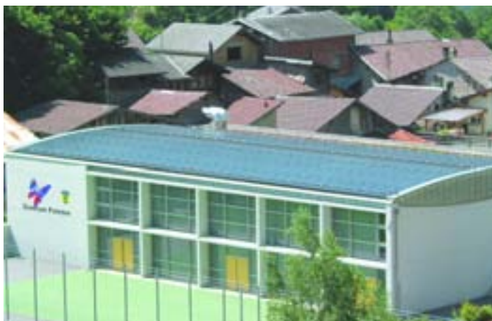
Cubierta solar en el Polideportivo de Varen (Suiza)

Actualmente numerosos edificios de oficinas, museos, clínicas y hospitales, centros de conferencias, centros comerciales, etc, se benefician de este tipo de solución. ■