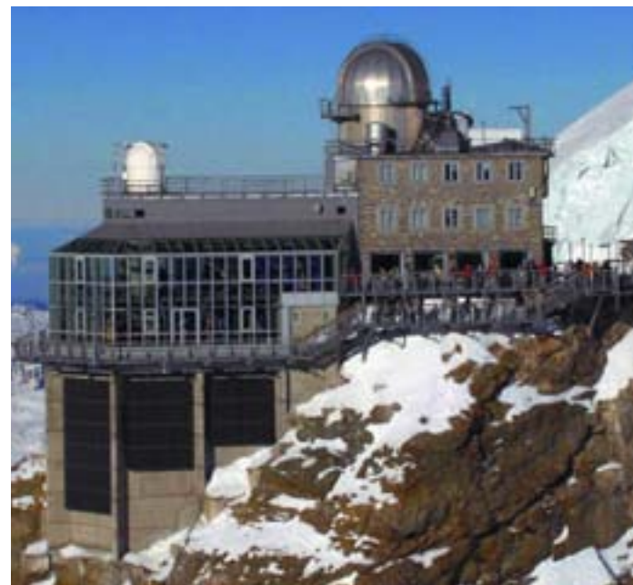
Instalación de 11,6kW con paneles Kyocera en el Jungfrauoch-Sistema fotovoltaico conectado a red más alto del mundo

El TRI-KA es una herramienta imprescindible para la instalación y mantenimiento de plantas fotovoltaicas que consta de dos dispositivos: el propio TRI-KA y el TRI-SEN. Mediante un novedoso sistema de medición, y con sólo pulsar un botón, el TRI-KA realiza la medición de la tensión de circui-