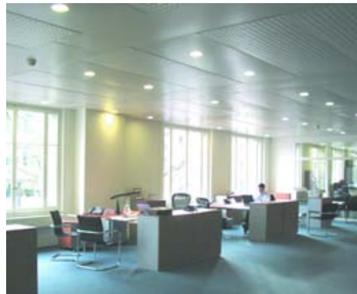
Plafones Radiantes en edificio de oficinas

Esta solución, desarrollada en Suiza a principios de la década de los 90, ha demostrado propiedades muy adecuadas para los países del Sur de Europa donde los