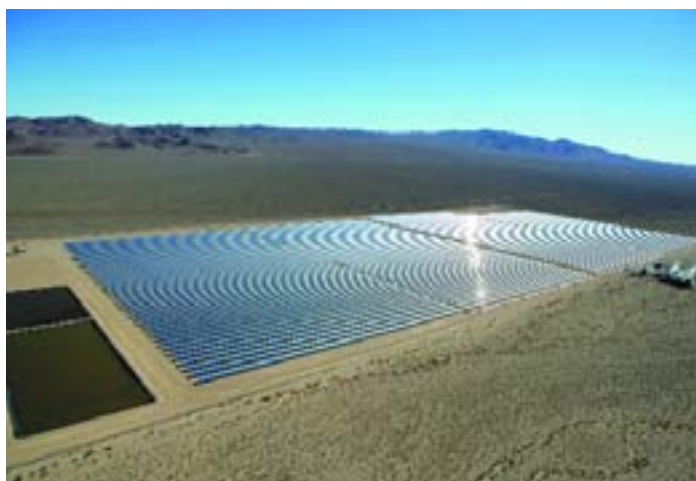
La planta termosolar "Nevada Solar One", propiedad de ACCIONA, es la mayor construida en el mundo en los últimos 18 años