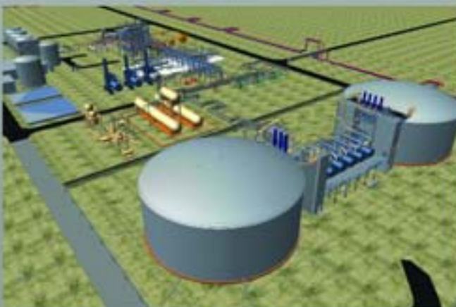
Central Termosolar Manchasol 1, 50 MW (en construcción), Ciudad Real (España)